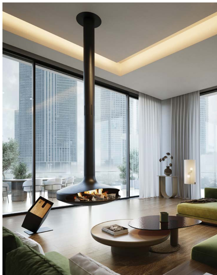
GYROFOCUS BIOETHANOL ©DOMINIQUE IMBERT

Dernier né de la gamme Focus outdoor, Bubble® est un brasero à bois destiné à une installation en extérieur. Conçu par Christophe Ployé, responsable des projets design chez Focus, Bubble® a séduit dès ses débuts le marché des professionnels et du monde du design en remportant le très convoité German Design Award 2022. Aujourd'hui, il vient de remporter l' Iconic Awards Innovative Architecture , qui distingue l'architecture la plus innovante, les designers voyants du secteur, avant-gardistes et jeunes talents du design.