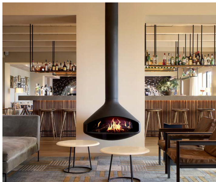
ERGOFOCUS HOLOGRAPHIK® ©DOMINIQUE IMBERT